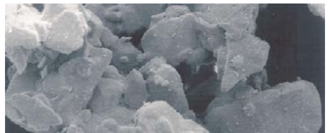
Ātri šķīstošā cukura daļiņa 600-kārtīgā palielinājumā. Attēlā var redzēt daļiņas poraino virsmu.